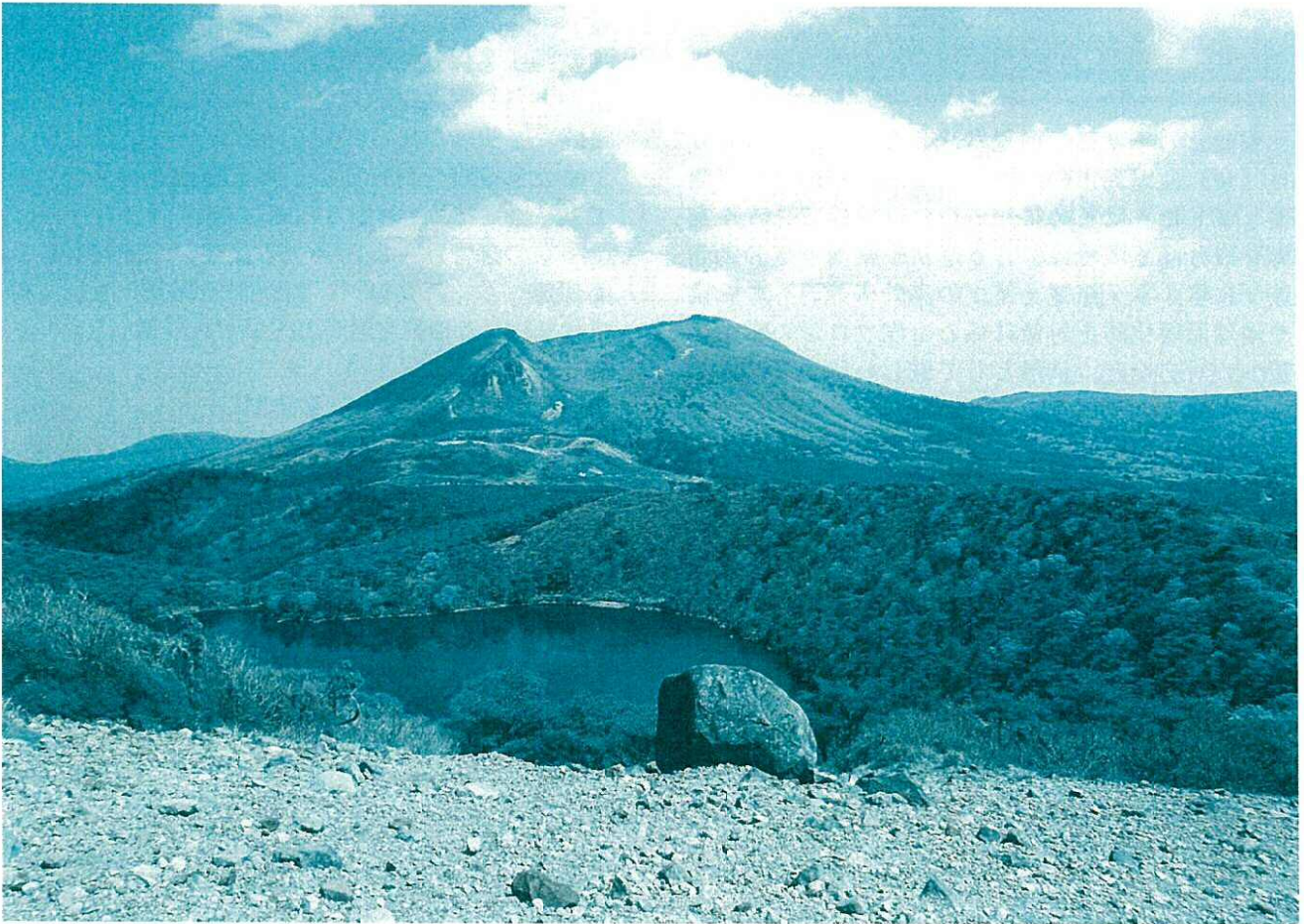
—白鳥山から白紫池・韓国岳を望む（霧島連山）—