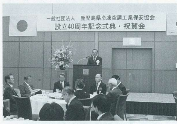
鎌田会長あいさつ