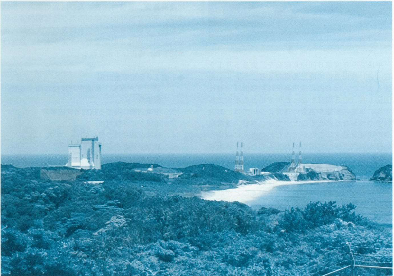
—種子島宇宙センター（南種子町）—