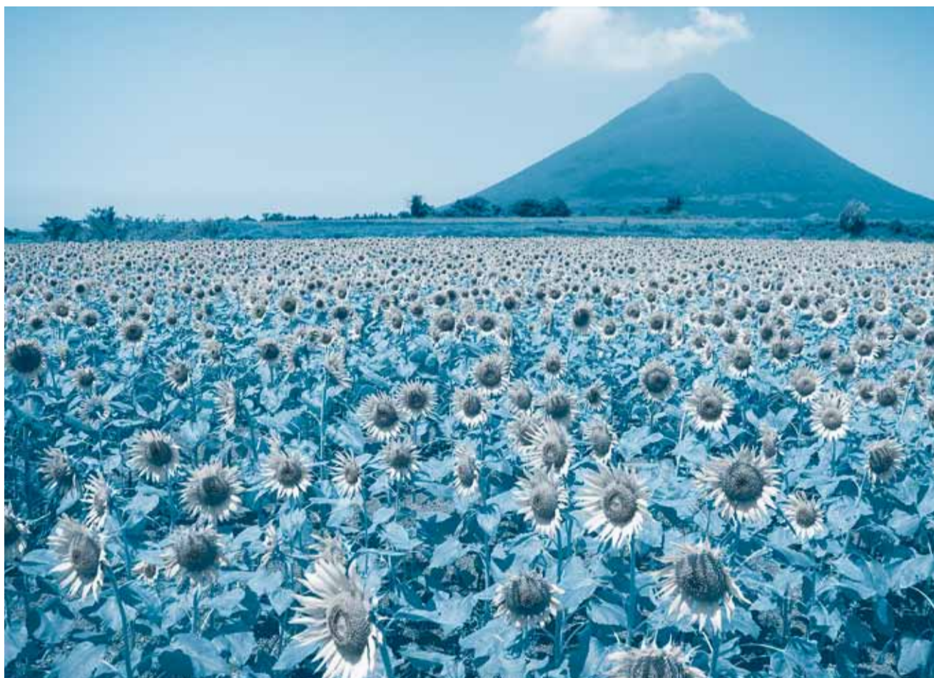
—ひまわりと開聞岳（指宿市）—