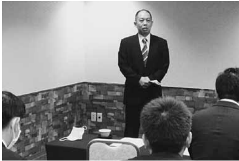
(冒頭挨拶：眞鍋前会長)

青年部会の第21期通常総会が、去る6月12日(金)鹿児島市のホテルレクストン鹿児島で開催された。